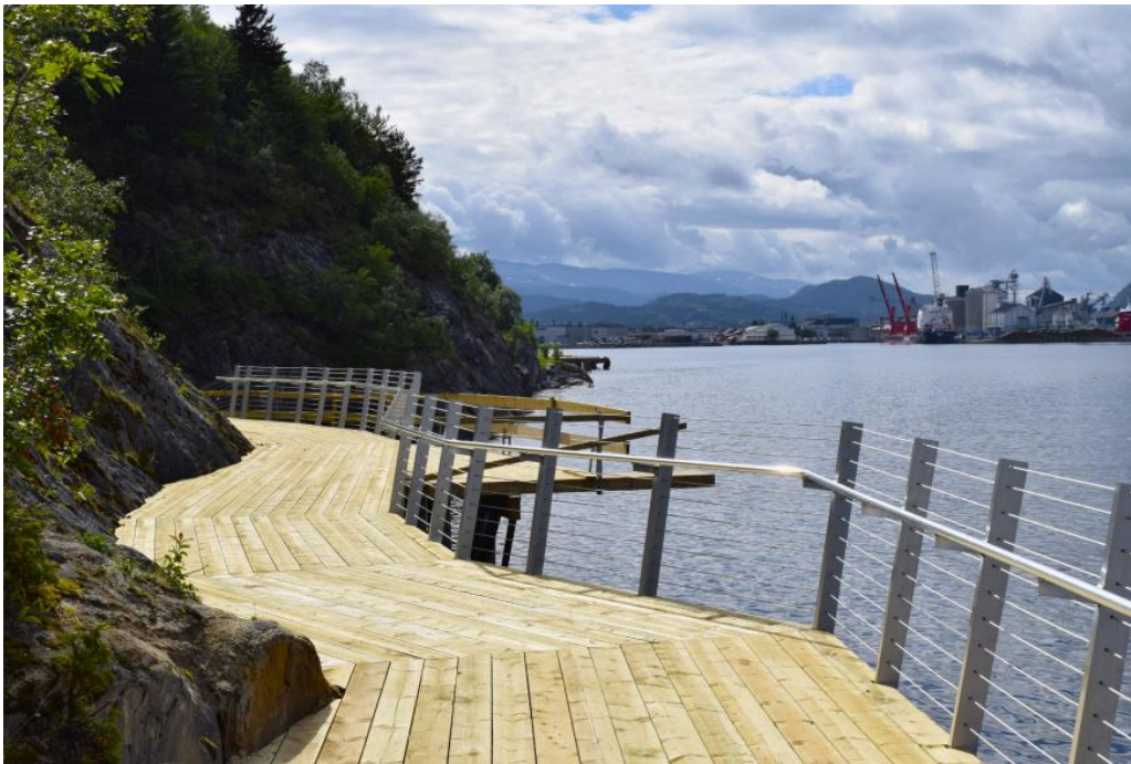
Bryggesti ferdigstilt høsten 2024.

Tilskudd er gitt til universell utformet bryggesti med mulighet for fiskeing, bading og rekreasjon. Prosjektet er gjennomført i 2024.