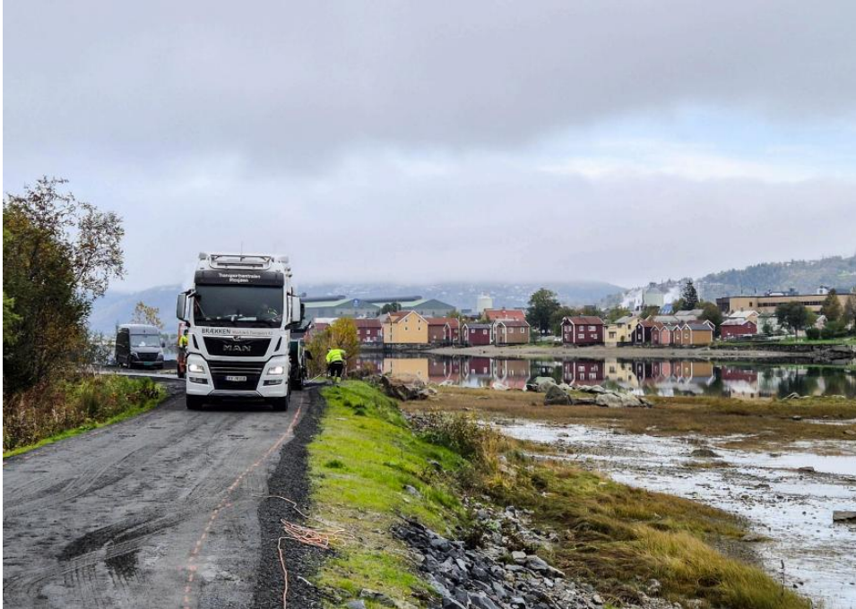
Høsten 2024 er det lagt asfalt på deler av turveien ut mot Øyøra/Marsøra.

Tilskudd er gitt til å ferdigstille parkeringsplasser, etablere gang/sykkelvei til friluftslivsområdet (UU), belysning, sykkelparkering, beplantning og informasjonsskilt. Tiltakene ferdigstilles i 2025.