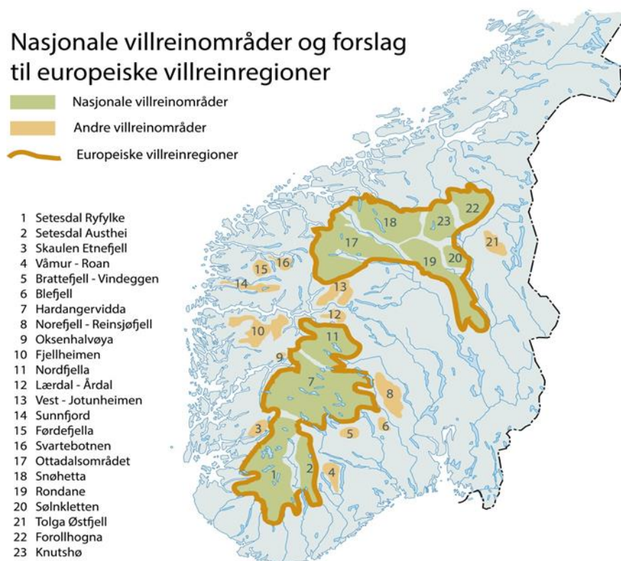
Figur 1. Nasjonale villreinområder og forslag til to europeiske villreinregioner.

Klima- og miljøministeren nedsatte i juni 2014 en arbeidsgruppe som skulle arbeide videre med innføringen av europeiske villreinregioner. Arbeidsgruppen skulle blant annet fremme forslag til hvordan man skal etablere europeiske villreinregioner, og utvikle et forslag til en strategi for bred verdiskaping for europeiske villreinregioner, med mål om å skape vekst i reiselivet innenfor bærekraftige rammer. Med bred verdiskaping menes miljømessig, sosial og kulturell og økonomisk verdiskaping som gjensidig er avhengig av hverandre. Arbeidsgruppen skulle også gi vurderinger og anbefalinger om samhandling med handlingsprogrammene for regionale planer for de nasjonale villreinområdene. Rapporten fra arbeidsgruppen ( ØF-rapport 2015/05 ) ble overlevert til statsråden i juni 2015, og det vises til denne.